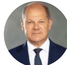
2023 Bundeskanzler Olaf Scholz

Prominente TeilnehmerInnen der letzten Hauptversammlungen: